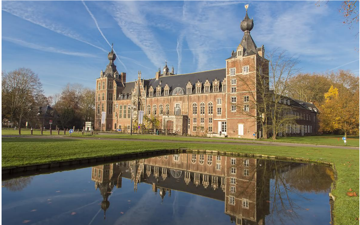
鲁汶大学风景照片（上 2 图）