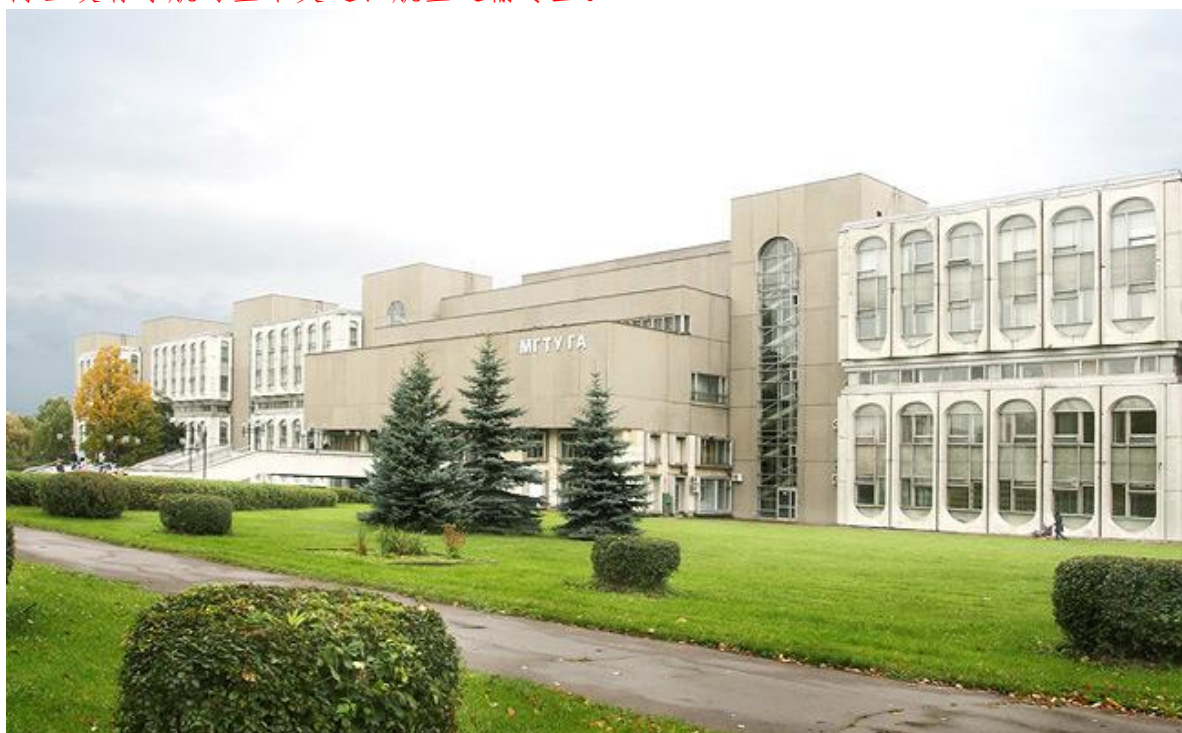
圣彼得堡国立民航大学照片

空运输、国民经济与管理、国际法欧洲法、气象学、气候学及农业气象学等专业； 博士设有导航与空中交通、航空运输专业。