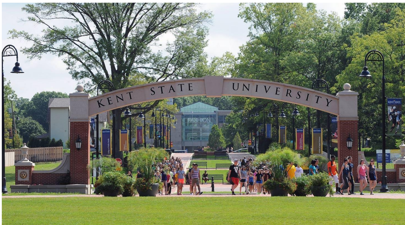
肯特州立大学图片